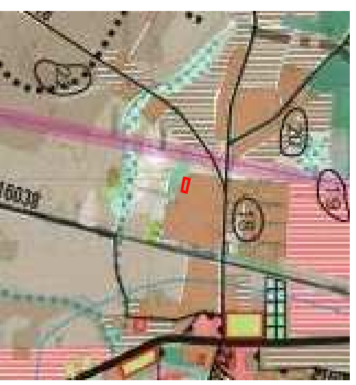
Wzrys ze Studium uwarunkowań i kierunków zagospodarowania przestrzennego gminy Subkowy uchwalonego Uchwałą Rady Gminy Subkowy XXI/18209 z dnia 26 sierpnia 2009 roku

— granice obszaru objętego projektem planu